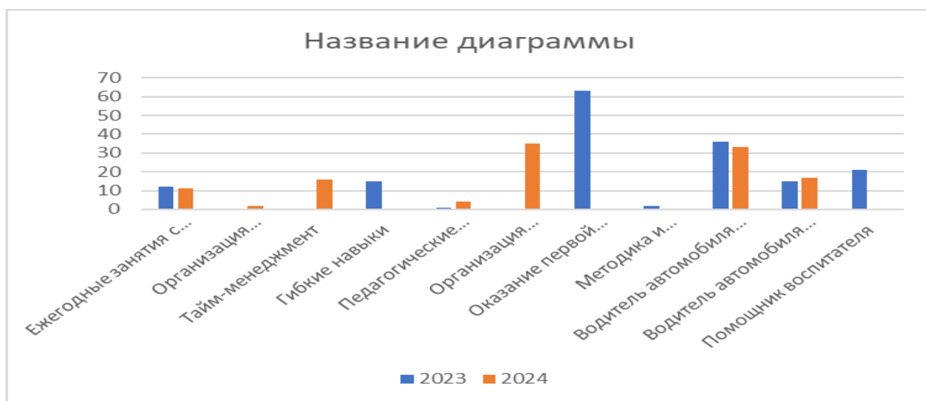
Рис.1 Диаграмма изменения контингента обучающихся колледжа по годам

В целом контингент колледжа в 2023 можно представить диаграммой на рисунке 1